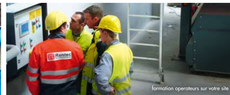
formation opérateurs sur votre site