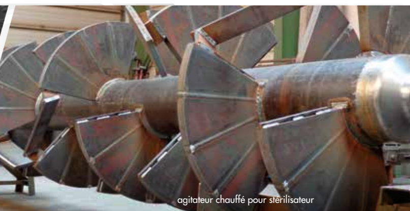
agitateur chauffé pour stérilisateur

Chaque entreprise connaît ses propres problèmes techniques. C'est pourquoi chez RENTEC, le travail sur mesure est la norme. Ensemble, nous implémentons vos exigences techniques spécifiques liées au produit. La planification et le développement du projet se font en étroite collaboration avec vous et font l'objet d'un ajustement continu jusqu'à l'obtention du résultat désiré : des machines et installations adéquates pour une amélioration de la production et une optimisation du processus.