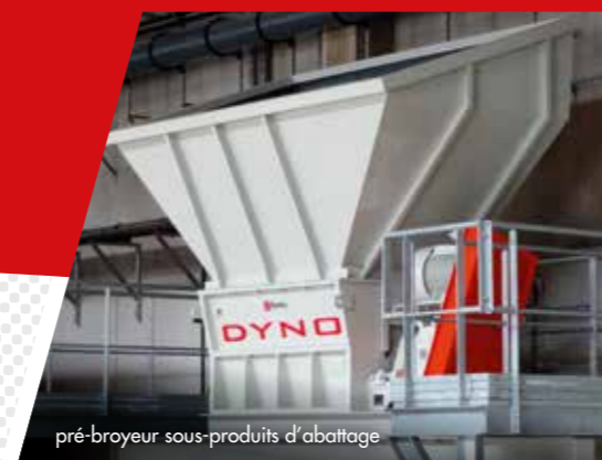
pré-broyeur sous-produits d'abattage