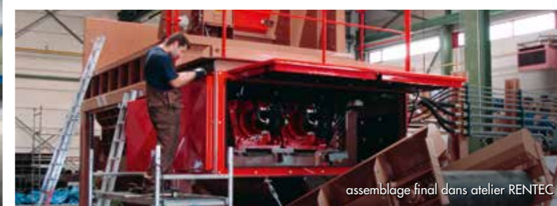
assemblage final dans atelier RENTEC