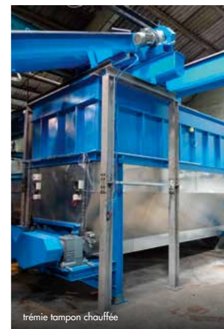
trémie tampon chauffée

Ensemble, nous trouverons des solutions qui fonctionnent.