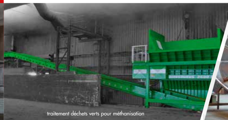
traitement déchets verts pour méthanisation